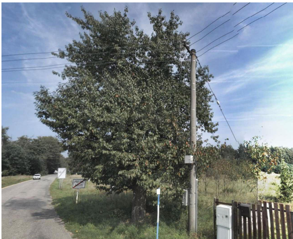
Fotografie č.1.: strom S1 - Třešň